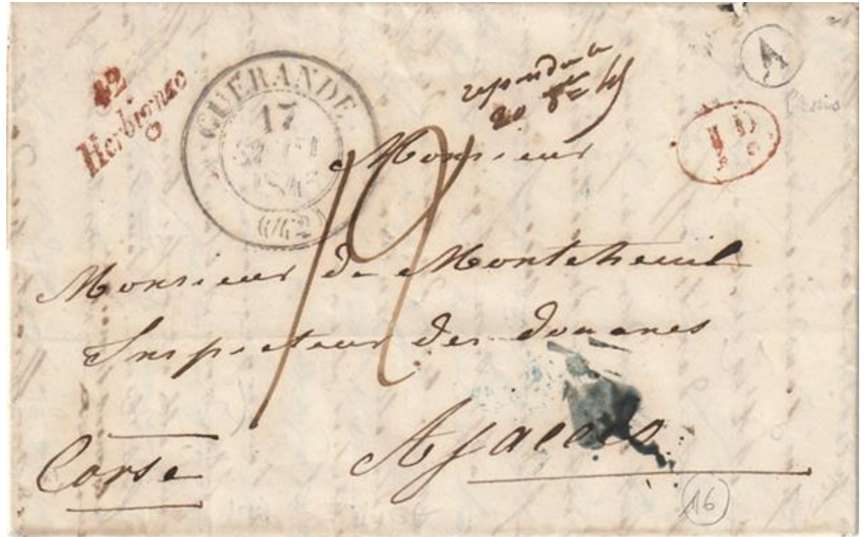
42 Herbignac en rouge. Boite Rurale A (le Plessis). 1845.

Les Bureaux secondaires peuvent être en correspondance avec plusieurs bureaux en fonction des routes de poste et de la destination.