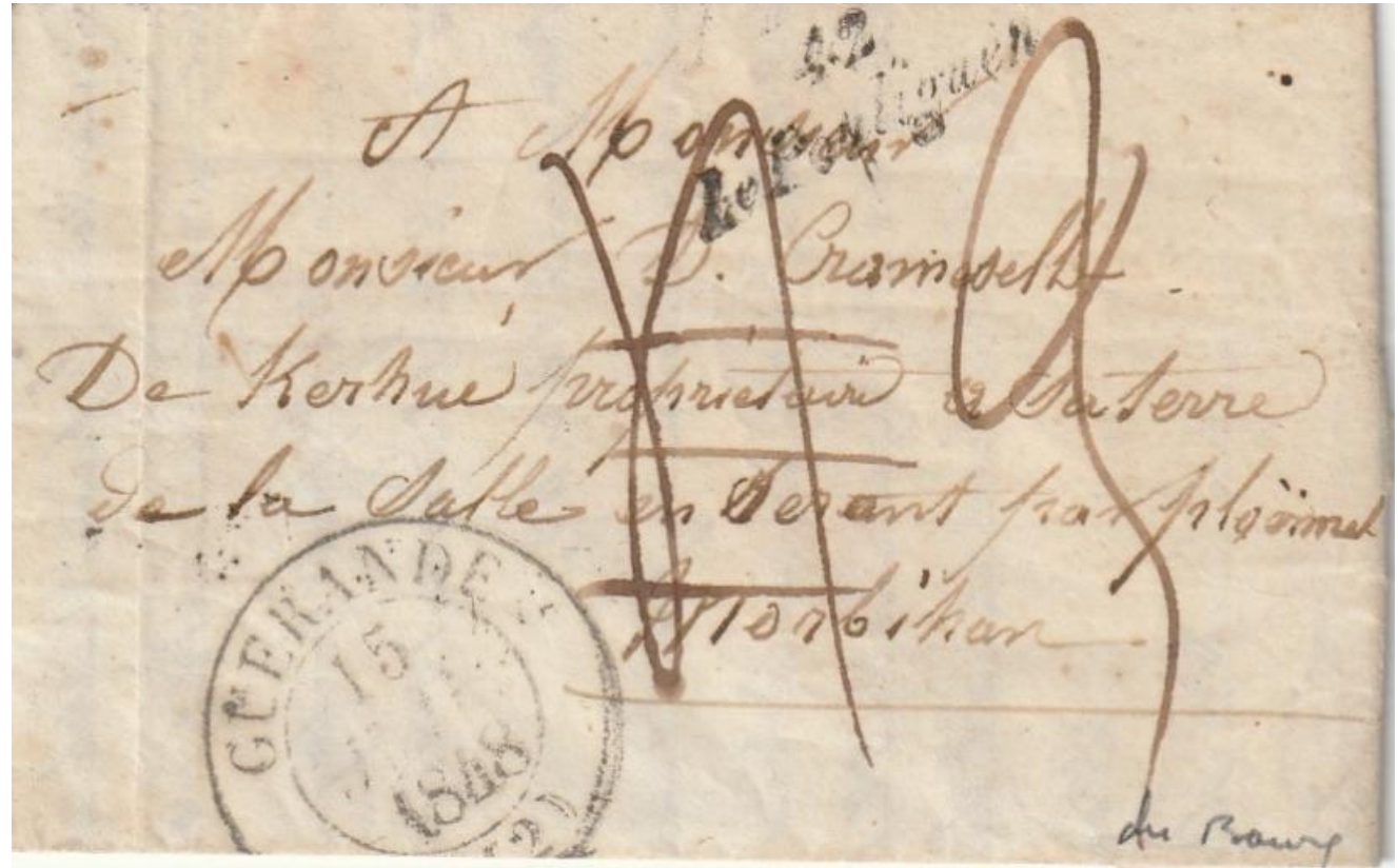
42 le Pouliguen. En correspondance avec le bureau de GUERANDE. 15 janvier 1848

Le Bureau de distribution du Pouliguen est créé en 1846