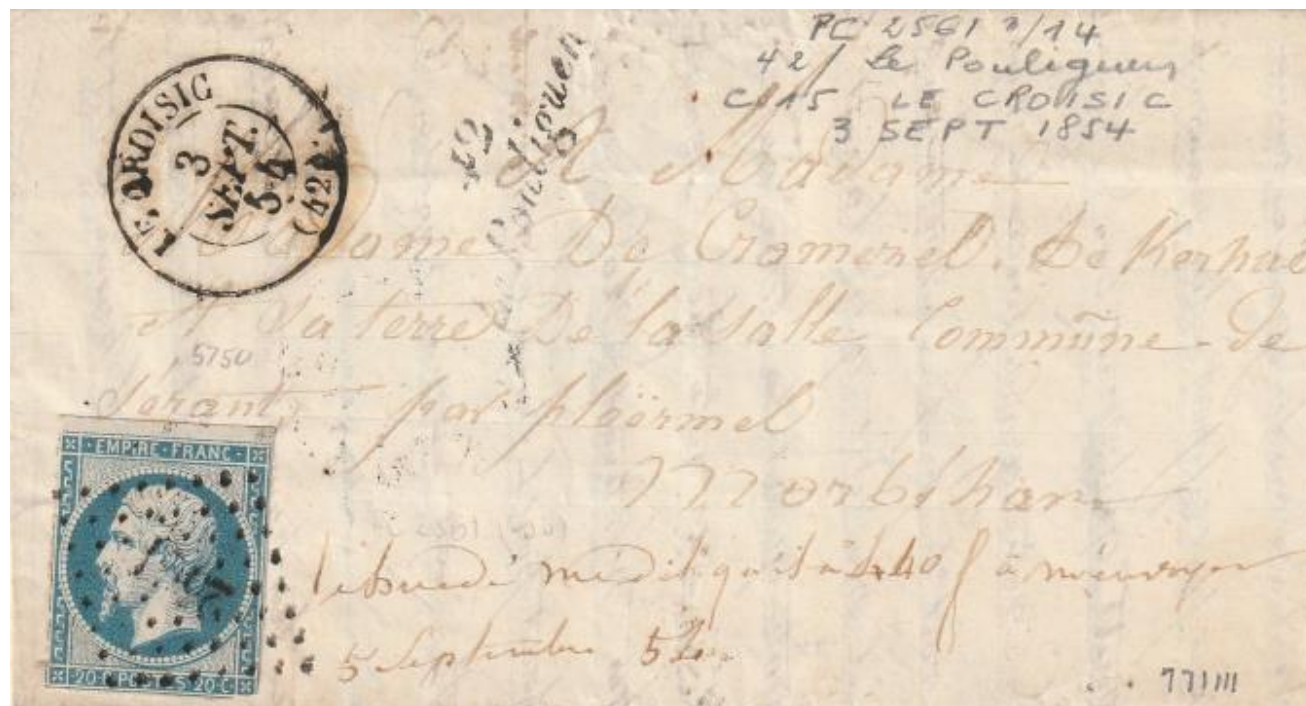
42 Le Pouliguen. TàD du Croisic 3/09/54 et oblitération losange PC 2561.

Le Bureau du Croisic étant passé en recette de plein exercice, le bureau de distribution du Pouliguen lui est affecté