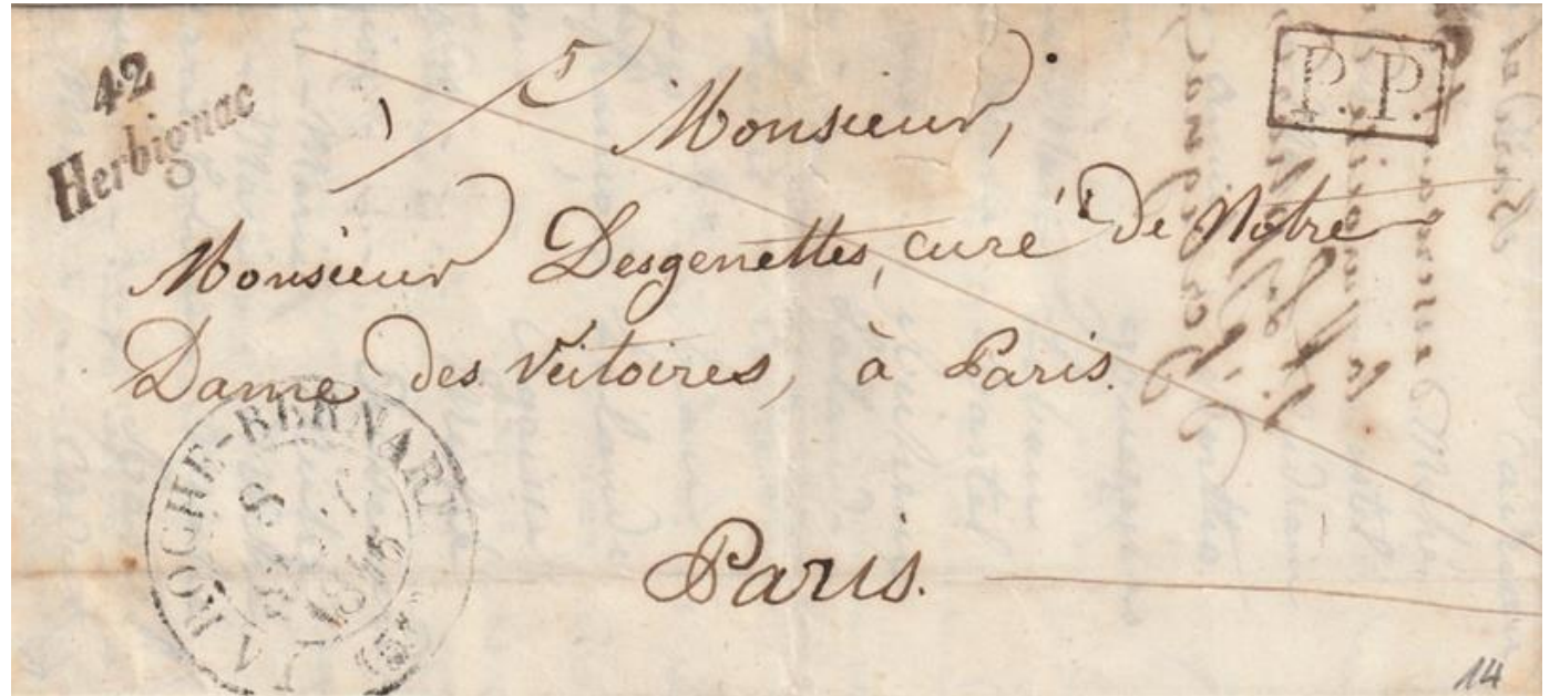
42 Herbignac en noir. 1845.

Les Bureaux secondaires peuvent être en correspondance avec plusieurs bureaux en fonction des routes de poste et de la destination.