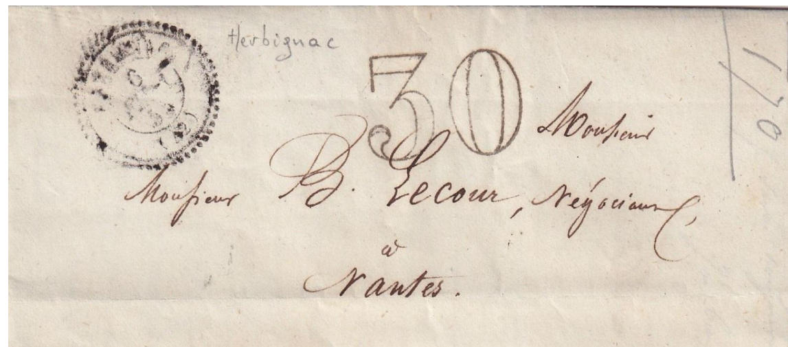
Herbignac: Lettre pour Nantes Tàd Type 22 HERBIGNAC 5février 1855 Lettre en port dû, taxée 30cts