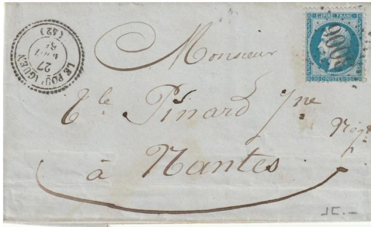
Le Pouliguen : Lettre pour Nantes Tàd Type 22 Le Pouliguen 27 aout 1861. Oblitération Losange GC 3006 sur 20cts Empire

Les cursives seront remplacées entre 1853 et 1856 par des timbres à date dits de Type 22