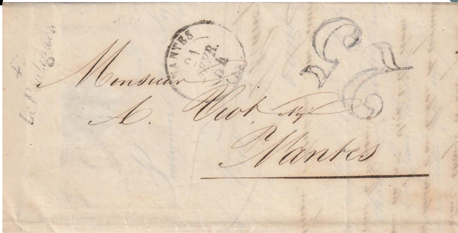
42 Le Pouliguen : TàD Nantes 21 février 1854 et taxe 25cts En correspondance directe avec le bureau de Nantes

Afin d'éviter des retards dans l'acheminement du courrier, Le bureau de distributions peut être aussi en correspondance directe avec un autre Bureau situé sur la même route