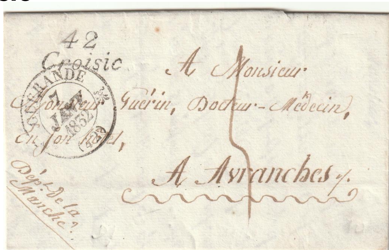
42 LE CROISIC : Cursive 2 lignes. Se rencontre de 1830 à 1833

Le 1 er novembre 1833, le bureau du Croisic du fait d'un fort trafic postal dû au développement du commerce du sel, est transformé en bureau de plein exercice